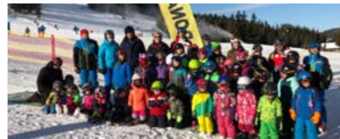
Skikurs auf der Sommeralm

zirkes 8 betraut, die am Sonntag, den 29. März, im Gartenhotel Ochsenberger stattfinden wird. Ein großes Dankeschön ergeht an dieser Stelle an alle Personen, die sich bei unseren Veranstaltungen immer wieder als Helfer zur Verfügung stellen.